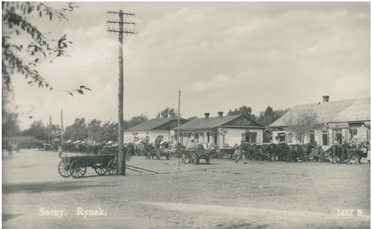
Сарни, ринок. 1939 р. 26

12 січня 1944 року Сарни були окуповані Червоною Армією.