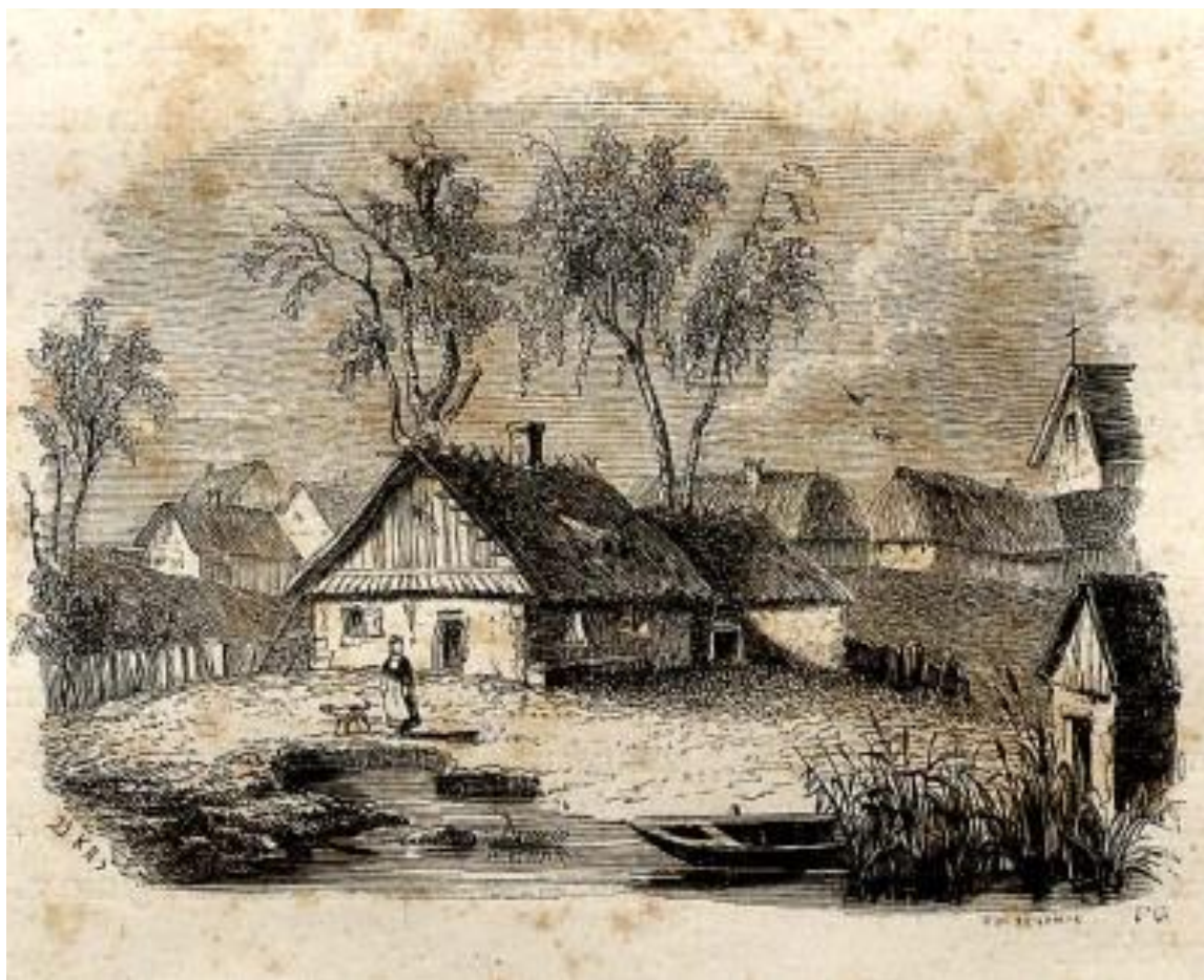
Околиці Серників в ХІХ столітті. 31

Серники — село у Зарічненській громаді Вараського району.