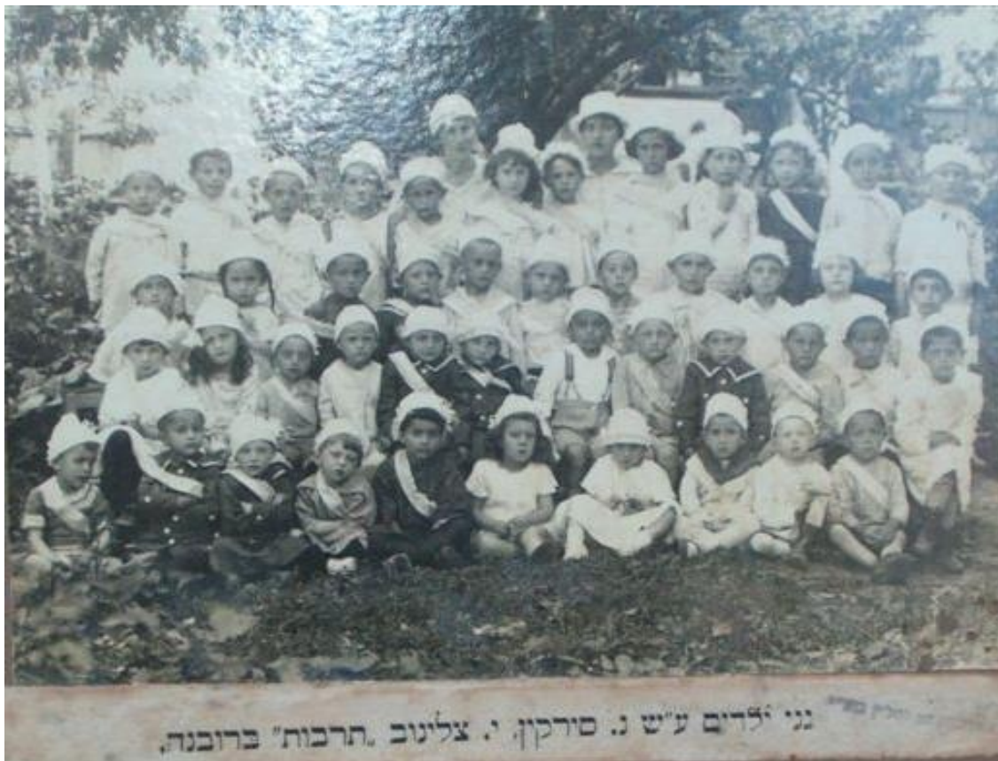
Вихованці єврейського дитячого садочка Тарбут. 10

У 1920-1930-х роках більшість промислових підприємств, ремісничих цехів і торгівельних установ Рівного належала євреям, які також становили три чверті вільних професій. У 1921 році в Рівному проживало 21 702 євреї (71% загального населення), а в 1931 році – 22 737 (56%). Місто було центром єврейської освіти з середньою школою Тарбут (для якої в 1936 році було побудовано нове приміщення), двома початковими школами та трьома дитячими садками. Крім того, існували дві єврейські гімназії з польською мовою навчання, а також школа імені Шолом-Алейхема з навчанням ідиш (до 1934 р.). У 1925 році до Рівного переїхала хасидська ешива. У місті виходили дві газети мовою їдиш.