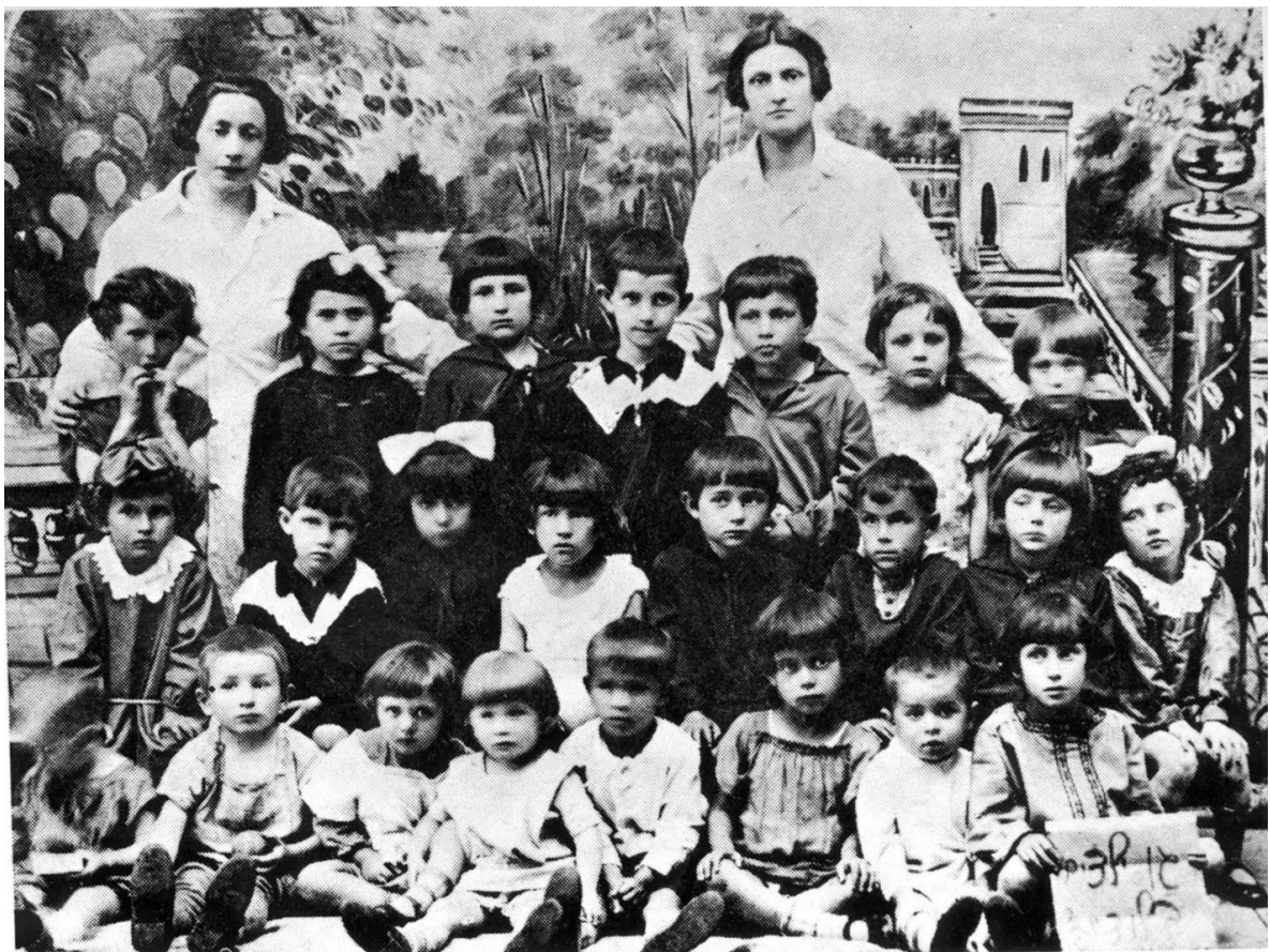
Людвипіль, єврейський дитячий садок. 1927 рік. 49

25-26 серпня 1942 року німецькі силовики ліквідували Людвипольське гетто, а його в'язнів розстріляли у військових казармах за містом. Всього вдалося втекти 300-350 євреям (переважно молоді). Однак більшість із них зрештою були спіймані та розстріляні.