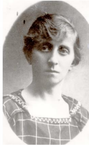
Гітл Принцель Народилася в Серниках. Гітл була вбитий під час Шоа. 37