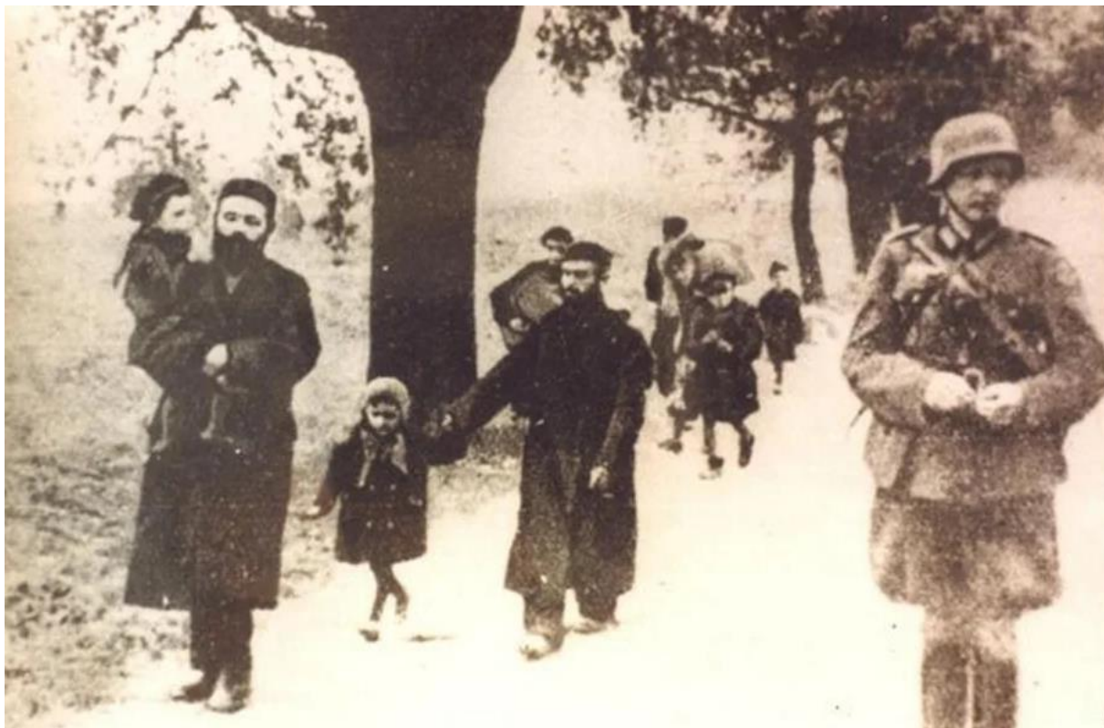
Тучин, євреї під конвоєм німецьких солдатів. 98

Gebiet Rowno. Гебітскомісаром був регіерунгсрат Вернер Беер. 96 Німецька жандармерія мала відділення у Тучині, якому підпорядковувалася місцева українська поліція. У перші дні німецької окупації відбулися погроми у яких близько 60 або 70 євреїв було вбито, а багато будинків пограбовано. Наступного дня айнзатцкоманда поліції безпеки (Sipo) і служби безпеки (SD), заарештувала та розстріляла 20 євреїв і 5 українців як радянських активістів і комуністів. 97