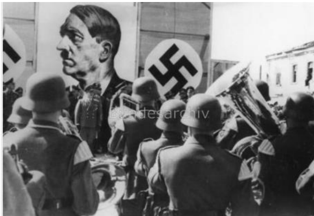
Парад, виступає Еріх Кох. Рівне, 20 квітня 1942 року. 6

20 серпня 1941 значну частину українських земель було включено до складу Райхскомісаріату «Україна» з центром у Рівному, райхскомісаром України призначено Еріха Коха.