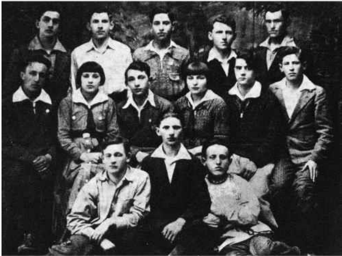
Члени організації «Гордонія», 1933 рік. 50