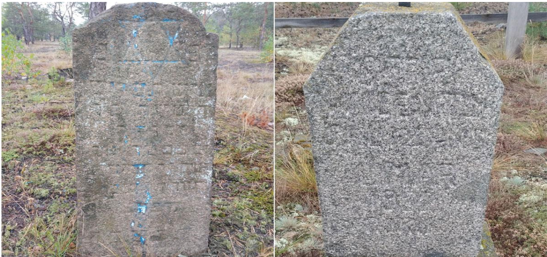
Мацеви на єврейському цвинтарі. Томашгород, 2018 р. 77

27-28 серпня німці почали вивозити в'язнів Поліського табору до сусіднього лісу на розстріл.