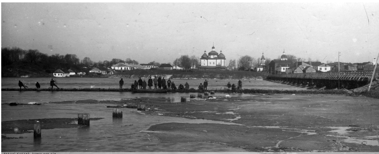
Степань, 1930-ті роки. 57

Степань — селище у Степанській селищній громаді Сарненського району.