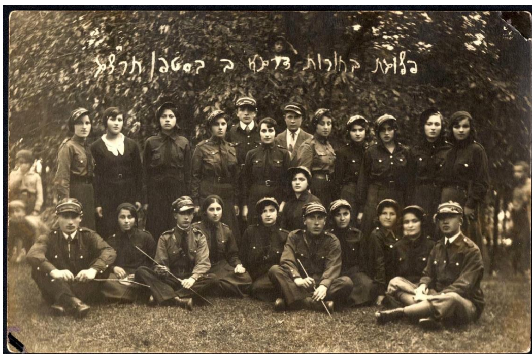
Учасники молодіжного руху «Бейтар». Степань, 1932-1933. 65

У міжвоєнний період місцеві євреї були переважно дрібними торговцями та ремісниками. Деякі євреї були власниками млинів або великими торговцями зерном і худобою, а інші здавали кімнати відпочиваючим. У Степані діяли численні сіоністські партії та молодіжні рухи (Хашомер Хацаїр, Бейтар, Мізрахі), Тарбут – сіоністська мережа навчальних закладів. У місті була сіоністська піонерська комуна ХЕ-ХАЛУЦ.