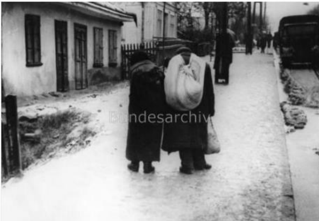
Старі та німецькі євреї прямують на збірний пункт. Рівне, 6 листопада 1941 року. 11