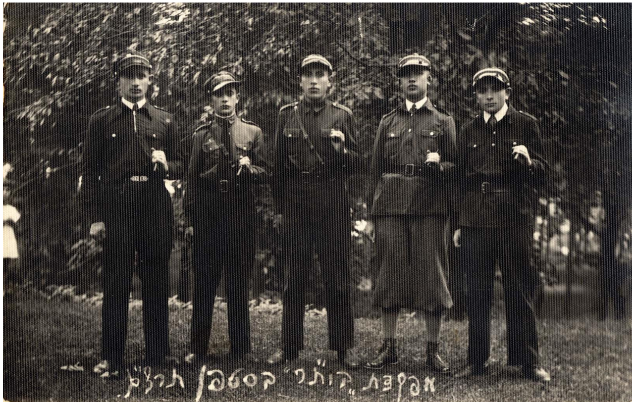
Лідери молодіжного руху «Бейтар». Степань, 1930-1931 рр. 67