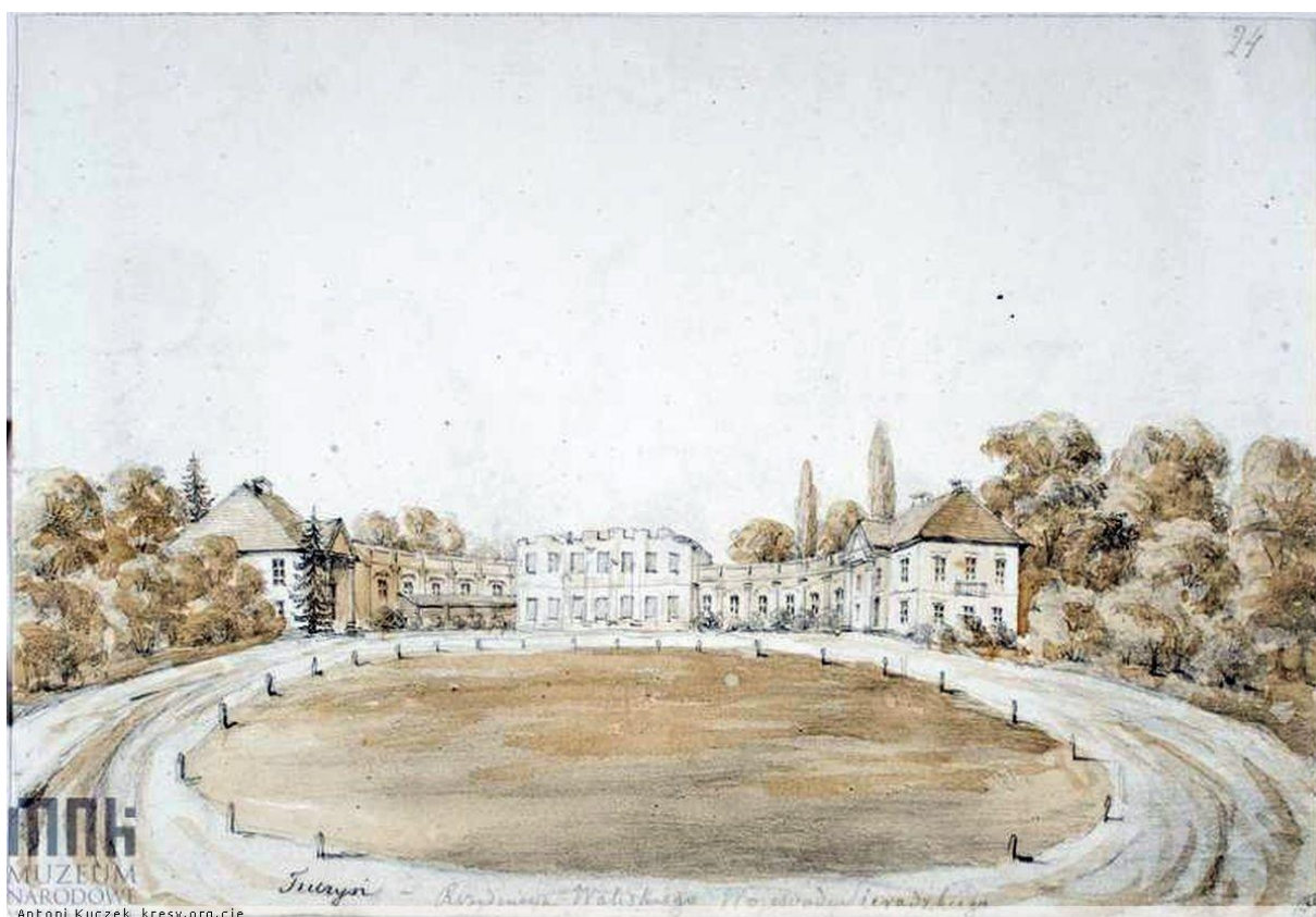
Палац Валевських. Тучин, 1862-1876 роки. 89

Тучин (пол. Tuczyn) — село у Гоцанській селищній громаді Рівненського району.