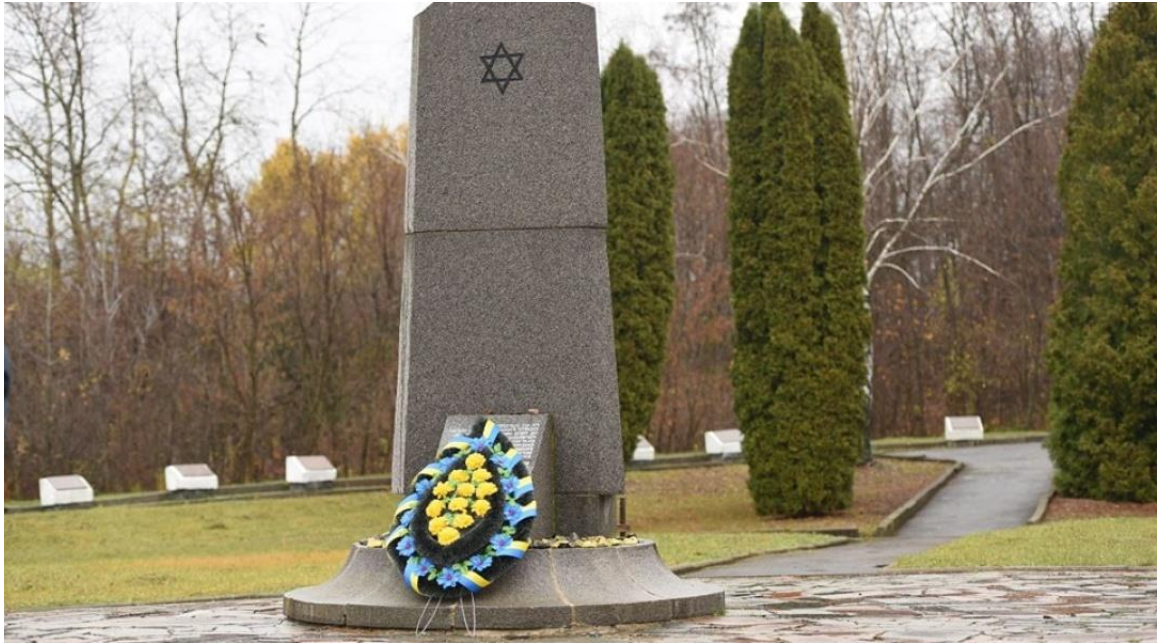
Меморіал в урочище Сосонка. 20