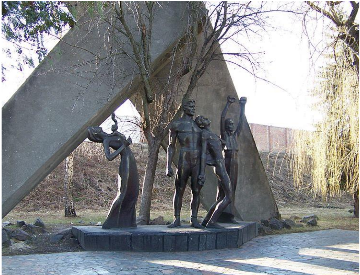
Рівне, меморіал на місці розстрілу близько 4 тис. євреїв, які перехувалися після ліквідації гетто. Тут також було розстріляно 80 тис. військовополонених. 21