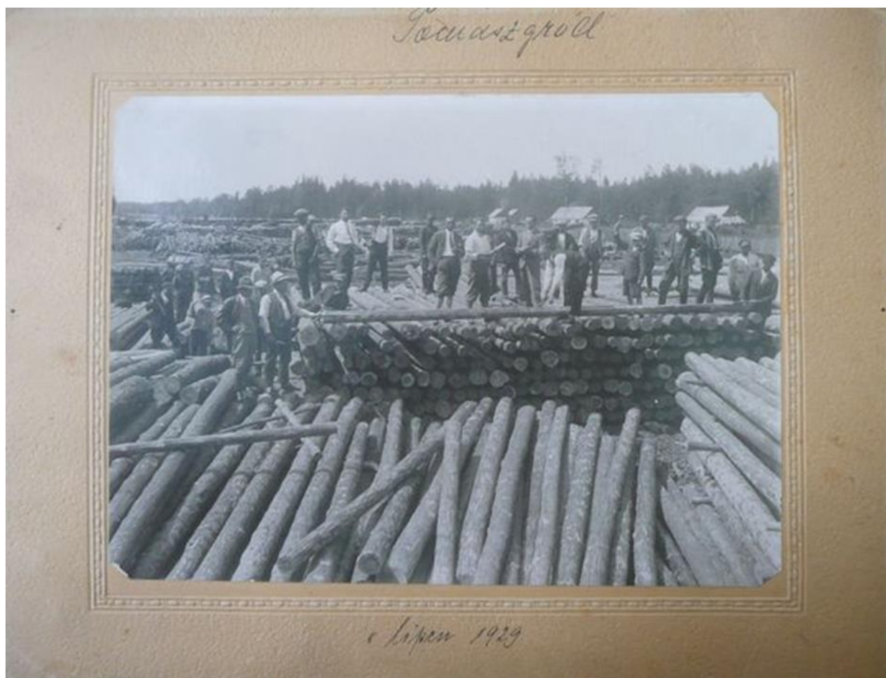
Томашгород, працівники лісопильні. липень 1929 року. 70

Томашгород — село, що входить до складу Рокитнівської територіальної громади Сарненського району.