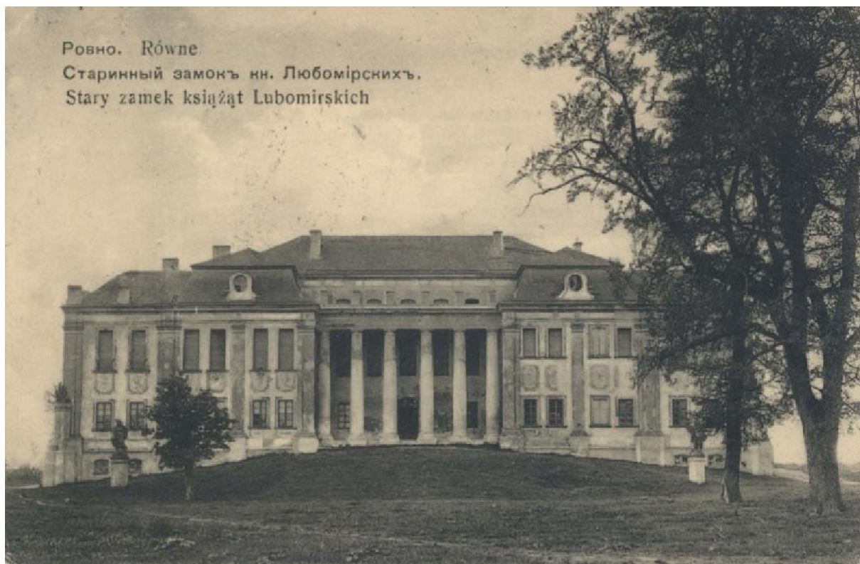
Палац князів Любомирських. Рівне, 1911 р. 2

Перша письмова згадка про Рівне, датована 1283 роком, міститься в латиномовній польській хроніці "Rocznik kapituły krakowskiej", де йдеться про переможну битву краківського і сандомирського князя Лешека Чорного з литовським військом. Однак, деякі розкопки можуть свідчити про те, що Рівне є стародавнім українським містом, адже, за твердженням дослідників, Рівне є 250 років старше: під час досліджень місцеві науковці відшукали будівлі, керамічний посуд, залишки зброї та будівель, датованих X століттям.