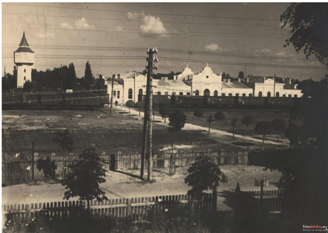
Сарни, залізнична станція. 1920-1939 рр. 23

Сарни — місто Сарненської міської громади та Сарненського району.