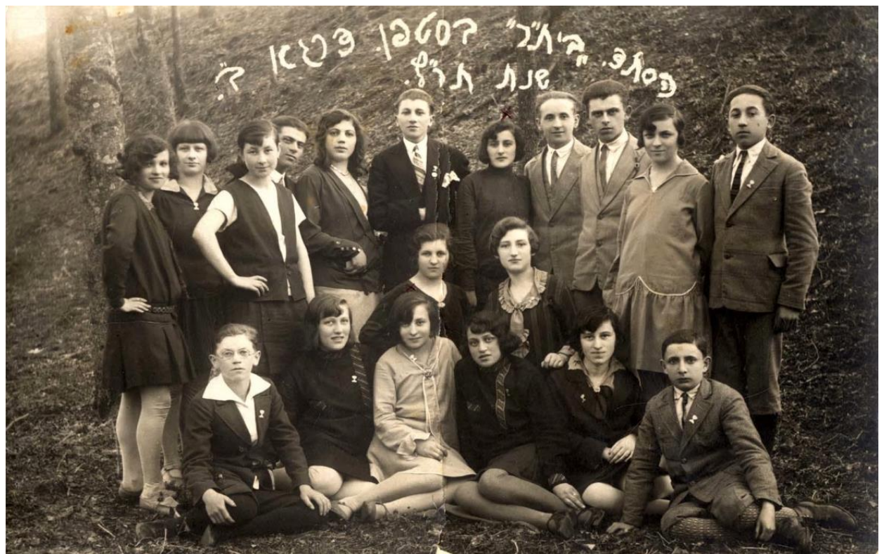
Степань, учасники руху «Бейтар». 1929-1930 рр. 68