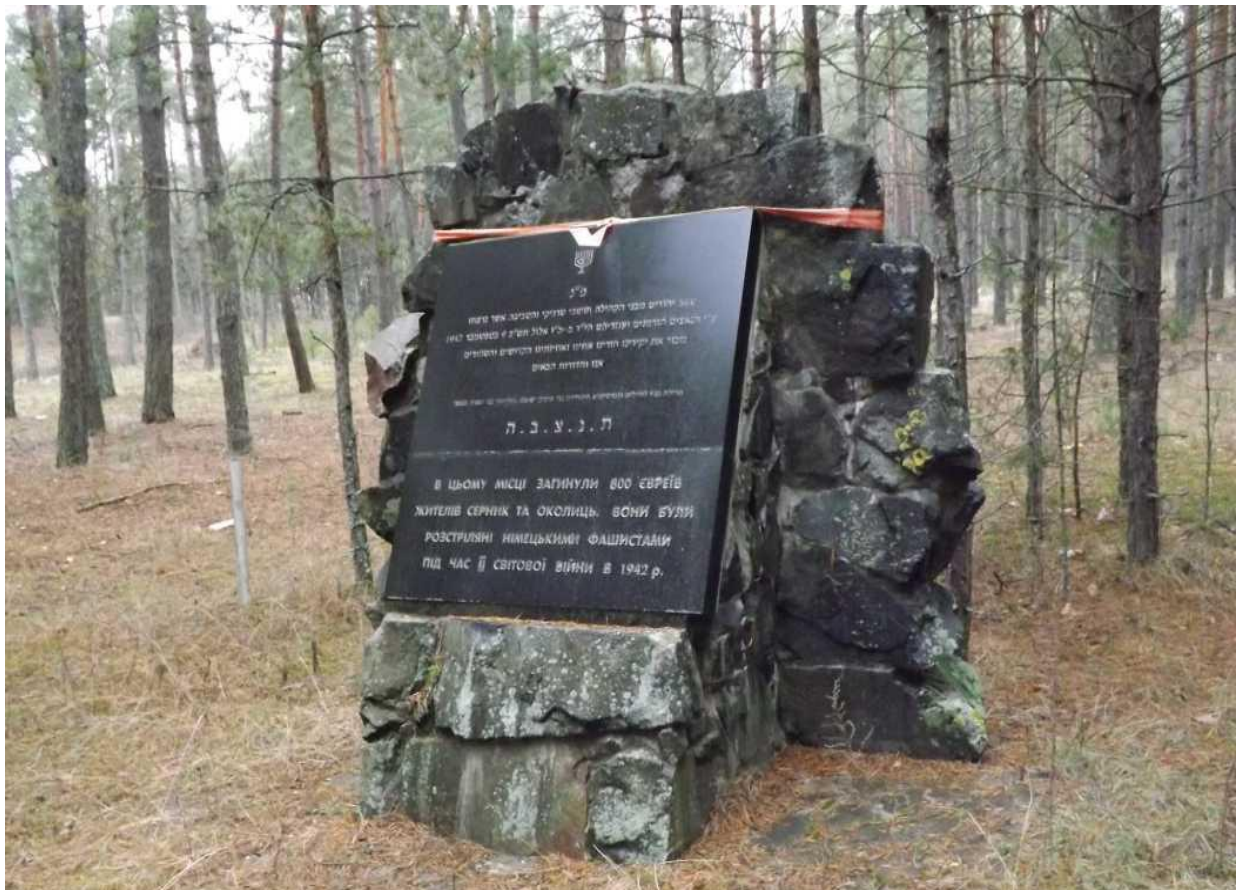
Місце розстрілу серненських євреїв.