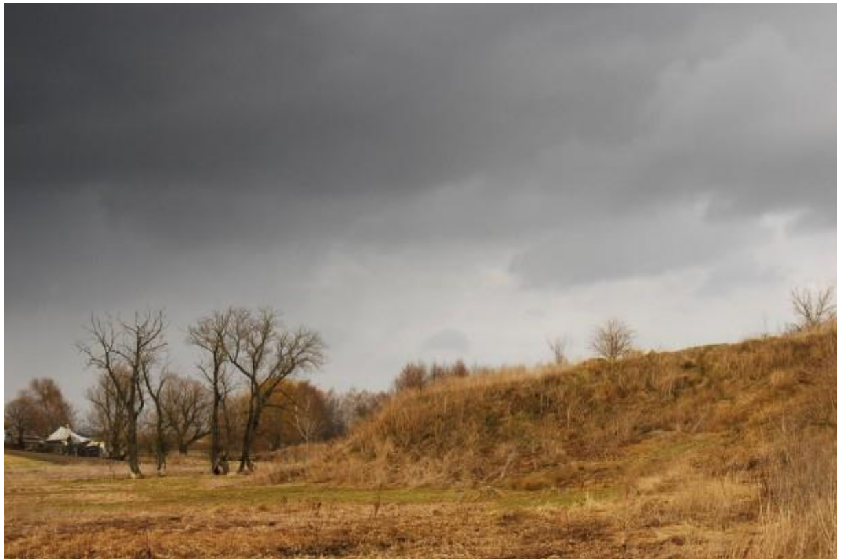
Місце розстрілу близько 1000 євреїв у Тучині. 106