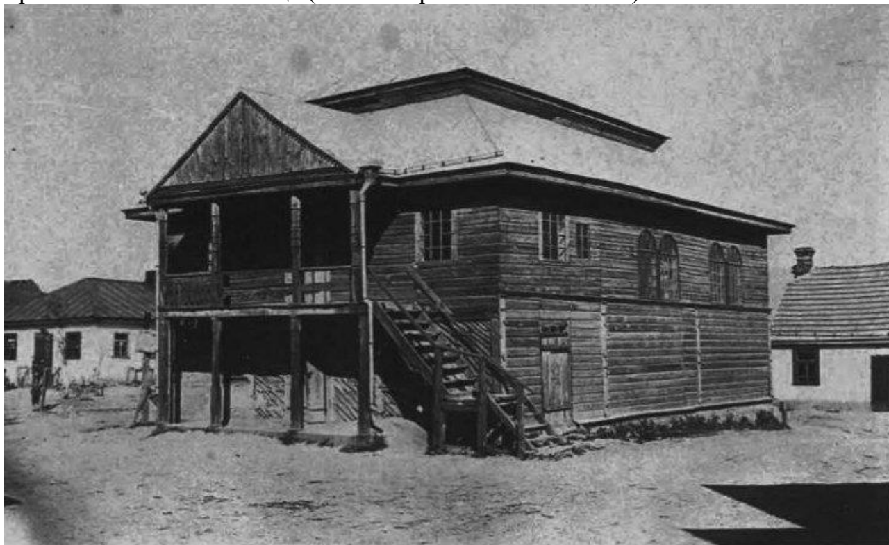
Синагога в Торговиці, 1930-ті роки. 84

більшого економічного організму; в околицях було ще чотири, суміжних «торговицьких» місцевості – село, млинницька слобода та два хутори, в яких проживало 391 мешканець (менше єврейського містечка).