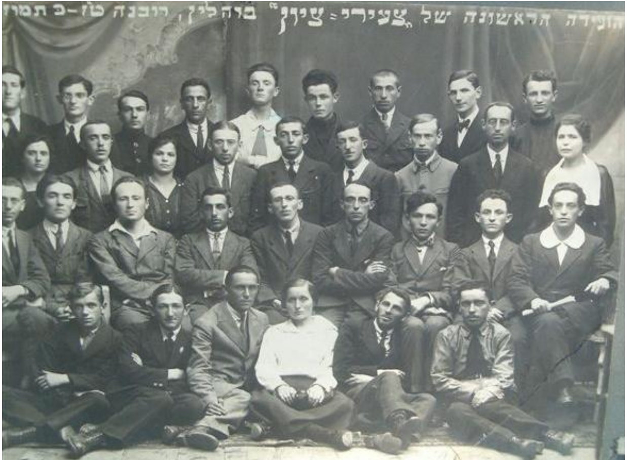
Учасники конференції Ховевей Ціон. Рівне, 1881 р. 9

Наприкінці XIX – на початку XX століття Рівне стрімко розвивалося, багато в чому завдяки будівництву двох залізничних колій (у 1870 та 1885 роках), які пройшли через місто. Його єврейське населення зросло з 3788 у 1847 році до 13780 у 1897 році (це становить 56% населення міста); до 19791 у 1913 р. (56,7%) 8 .