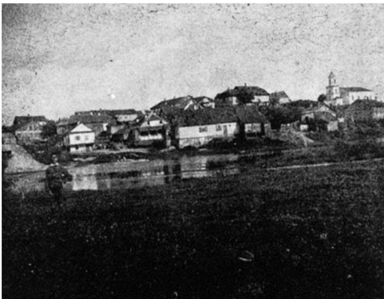
Вид на містечко Торговиця, міжвоєнний період. 79

Вперше в писемних джерелах Торговиця згадується в XV ст., а точніше в 1446 році.