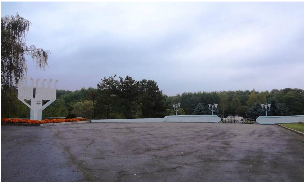
Меморіал в урочище Сосонка. 19

Багатьом євреям, особливо молодшим, вдалося втекти. Тих, кого знайшли, розстріляли восени 1942 року на військовій базі на вулиці Білій разом із радянськими військовополоненими. За словами свідка, якого опитав Яхад-Ін Унум, євреїв відвезли до місця розстрілу в критих вантажівках, змусили роздягнутися на складі, а потім бігти до ями. Серед постраждалих були жінки, діти та люди похилого віку. Кільком сотням євреїв вдалося пережити Голокост. 18