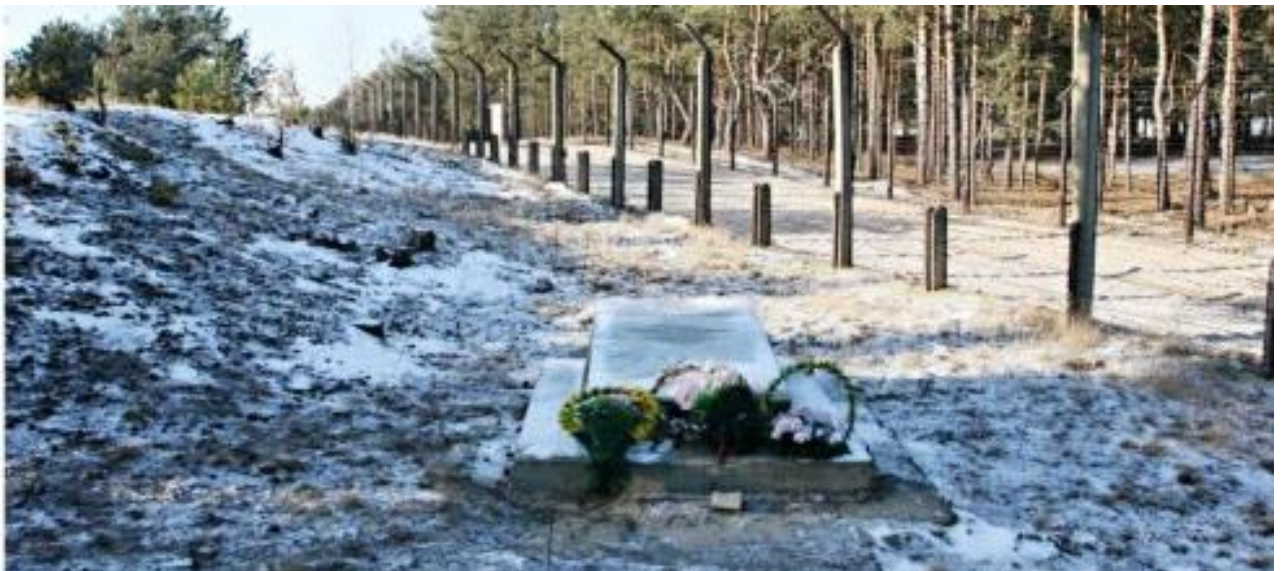
Місце розстрілу сарненських євреїв.