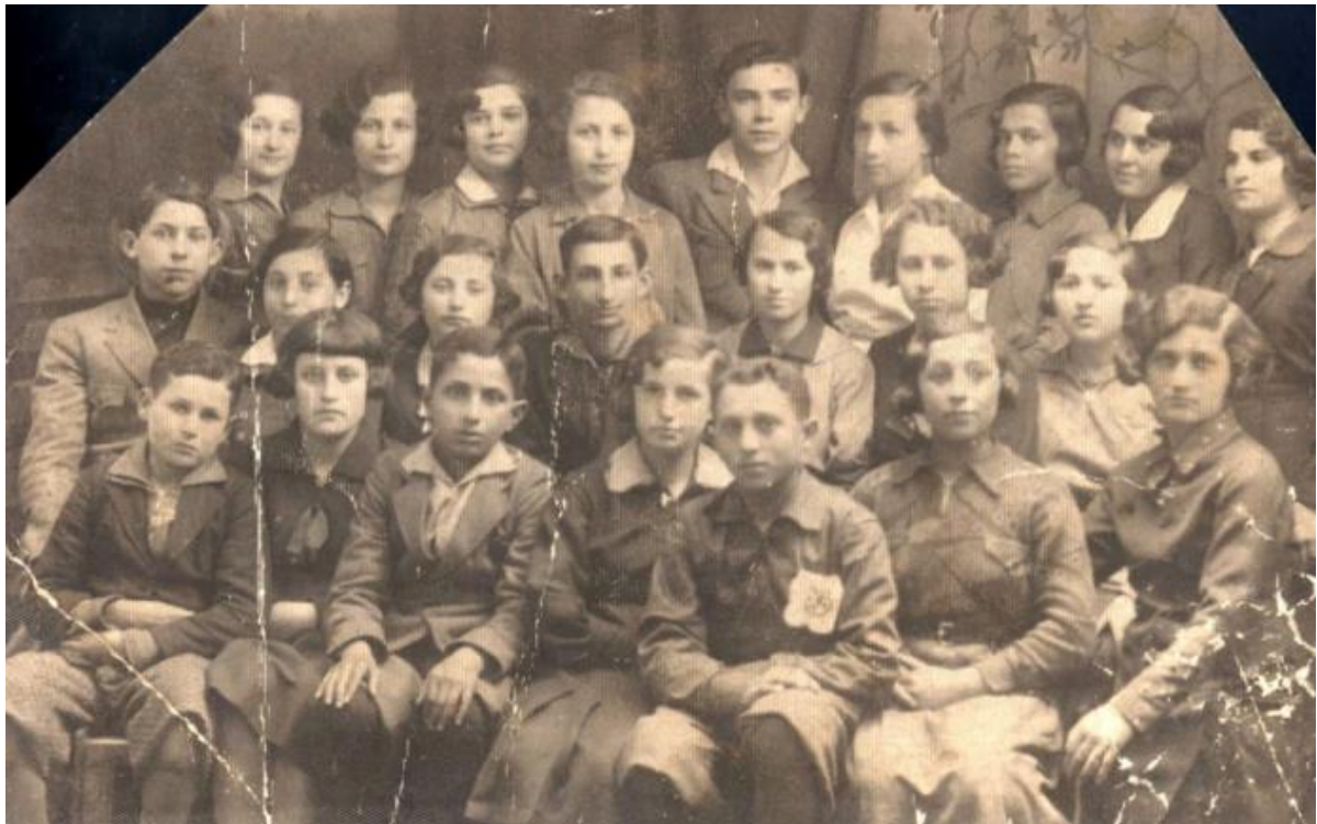
Сарни, учасники руху Ха-Шомер Хацаїр. 1930-ті роки. 28

Єврейські діти та молодь навчалися в різних закладах: івритомовному дитячому садку та початковій школі Тарбут, професійно-технічній школі ОРТ, Талмуд-Тора та ешиві. Місцеві політичні організації включали осередки Бунду, комуністів, а також різні сіоністські партії та їх молодіжні рухи (такі як Бейтар, Гордонія, Ха-Шомер Хацаїр). Члени руху «HeHalutz» були одними із засновників сіоністської навчальної бази в Клесові, а згодом вони емігрували до землі Ізраїль.