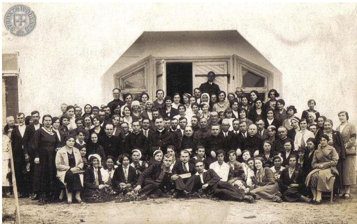
Мешканці Людвиполя, 1936-1939 рр. 40

Соснове (до 1946 року — Людвипіль) — селище, центр Соснівської селищної громади у Рівненському районі.