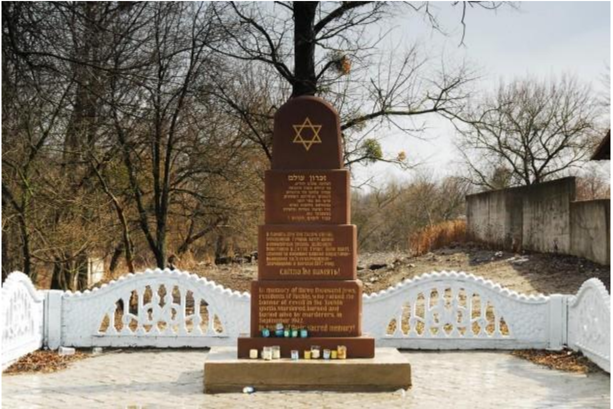
Пам'ятник споруджено на місці, де було тучинське гетто. 105