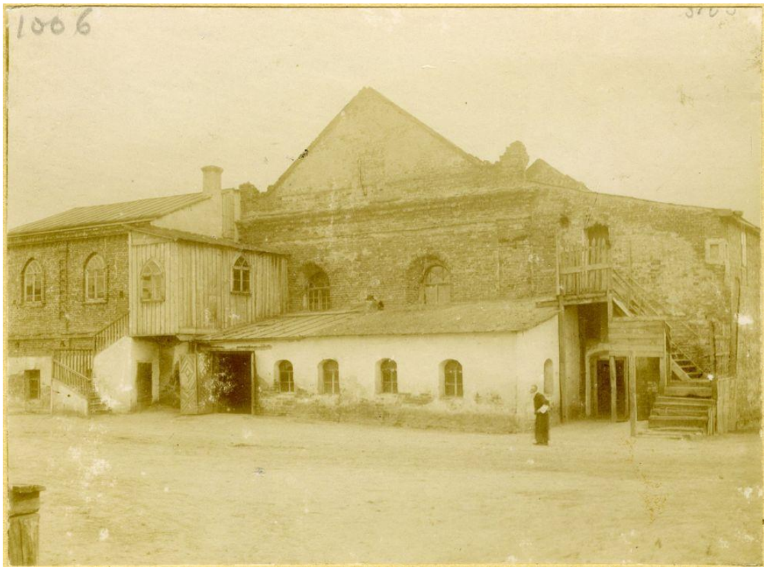
Степань, синагога. 1914 р. 63

У 1765 році в Степані та навколишніх селах проживало 1138 євреїв; у 1847 р. – 1717 євреїв у Степані; в 1897 році в містечку було 5137 осіб, з них 1854 євреїв.